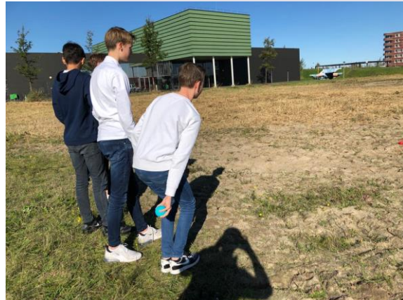
Leerjaar 3 – Franse dag