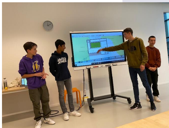
Leerjaar 3 geeft presentatie bij TU Delft

Goed onderwijs, daar zullen we ons ook dit jaar langs allerlei lijnen weer mee bezig houden. In deze nieuwsbrief leest u daar meer over.