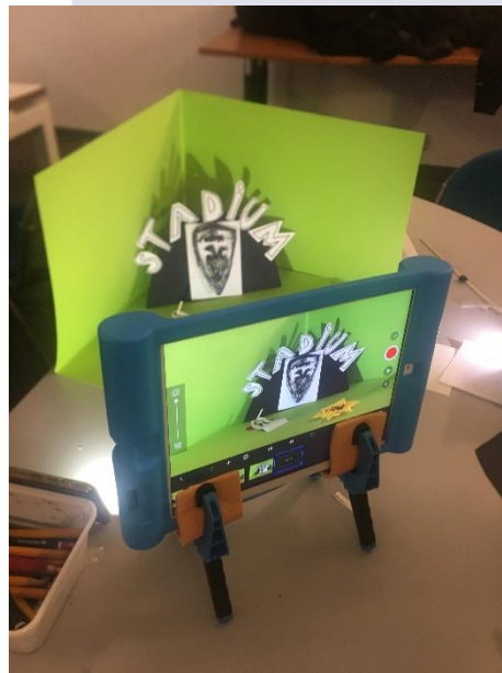
Leerjaar 4 – ckv-dag