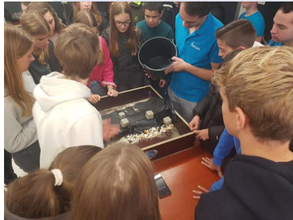
Leerjaar 3 vwo – TU Delft